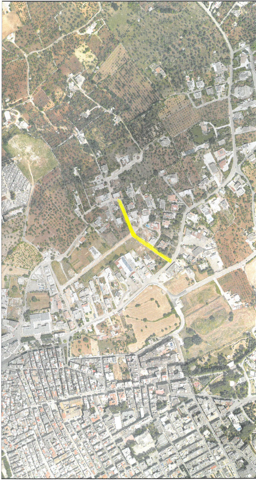
Tavola n. 4

Via Padre Giovanni Campanella (1914 – 2006) missionario del P.I.M.E