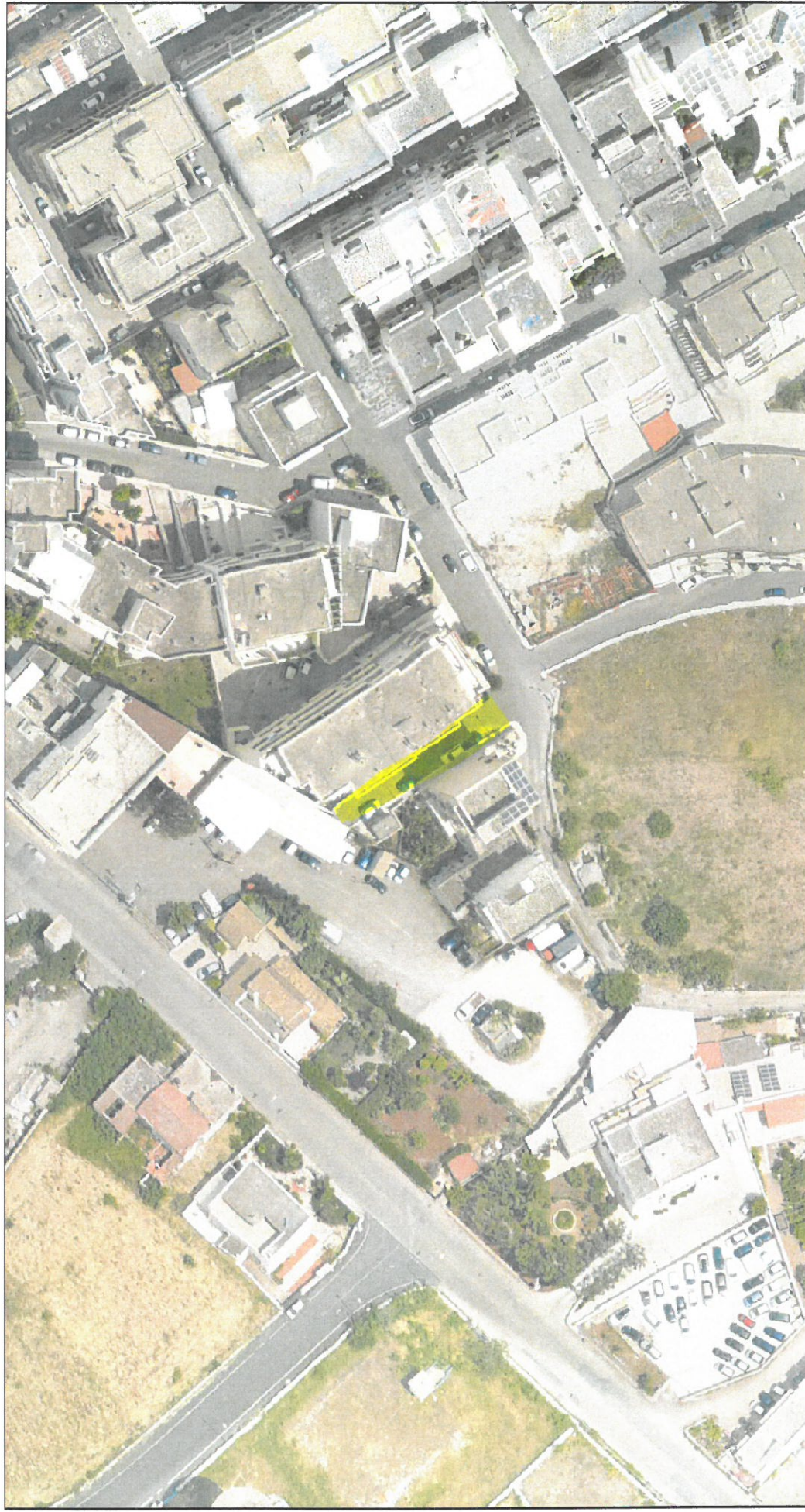
Tavola n. 1

Mappa Comune di Castellana Grotte