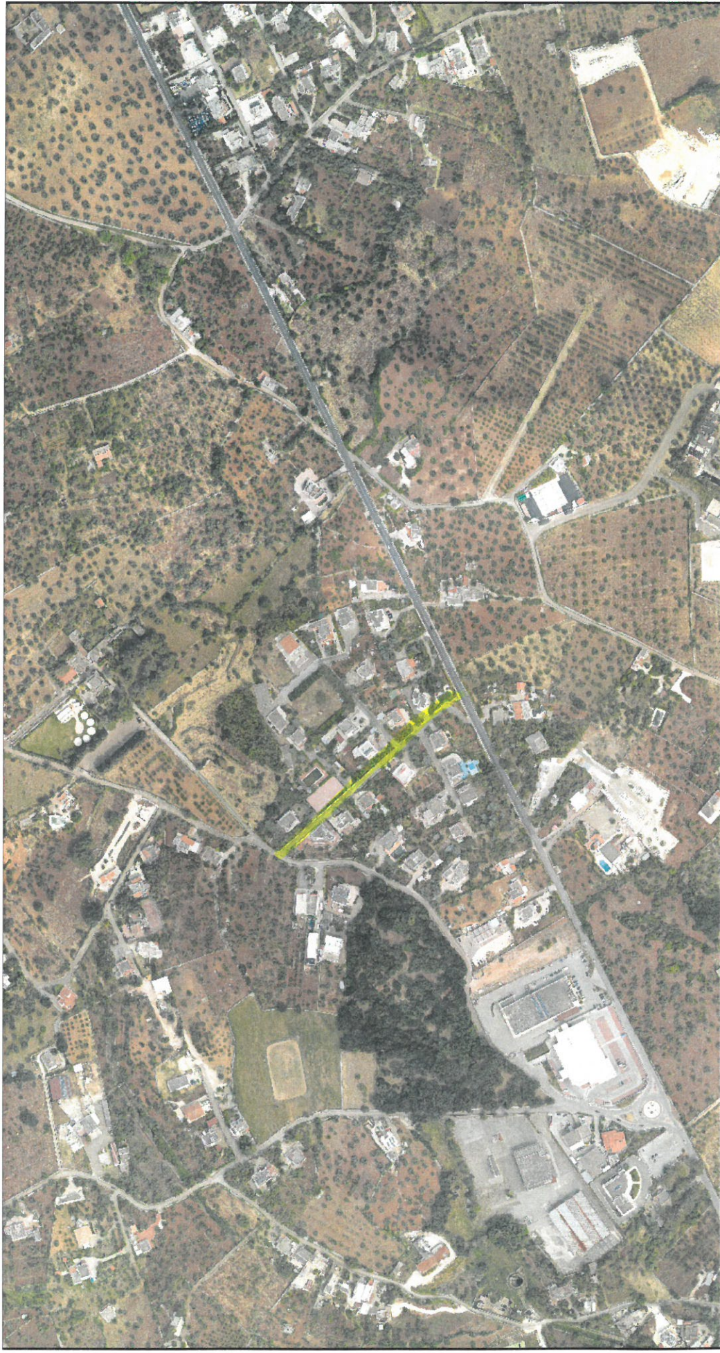
Tavola n. 6

Via Giovanni Mastromarino (1895 – 1993) agricoltore scrittore