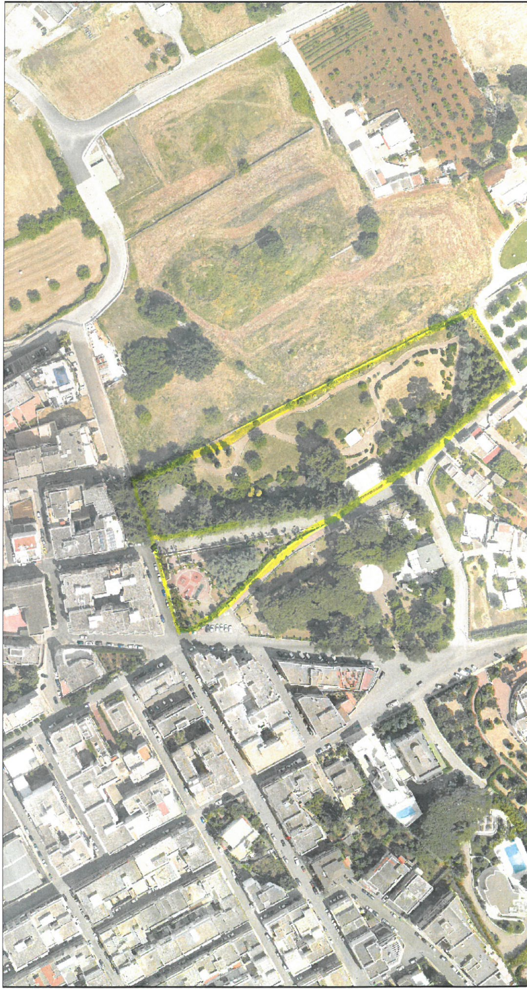
Tavola n. 7

Mappa Comune di Castellana Grotte (fonte: sistema webgis)