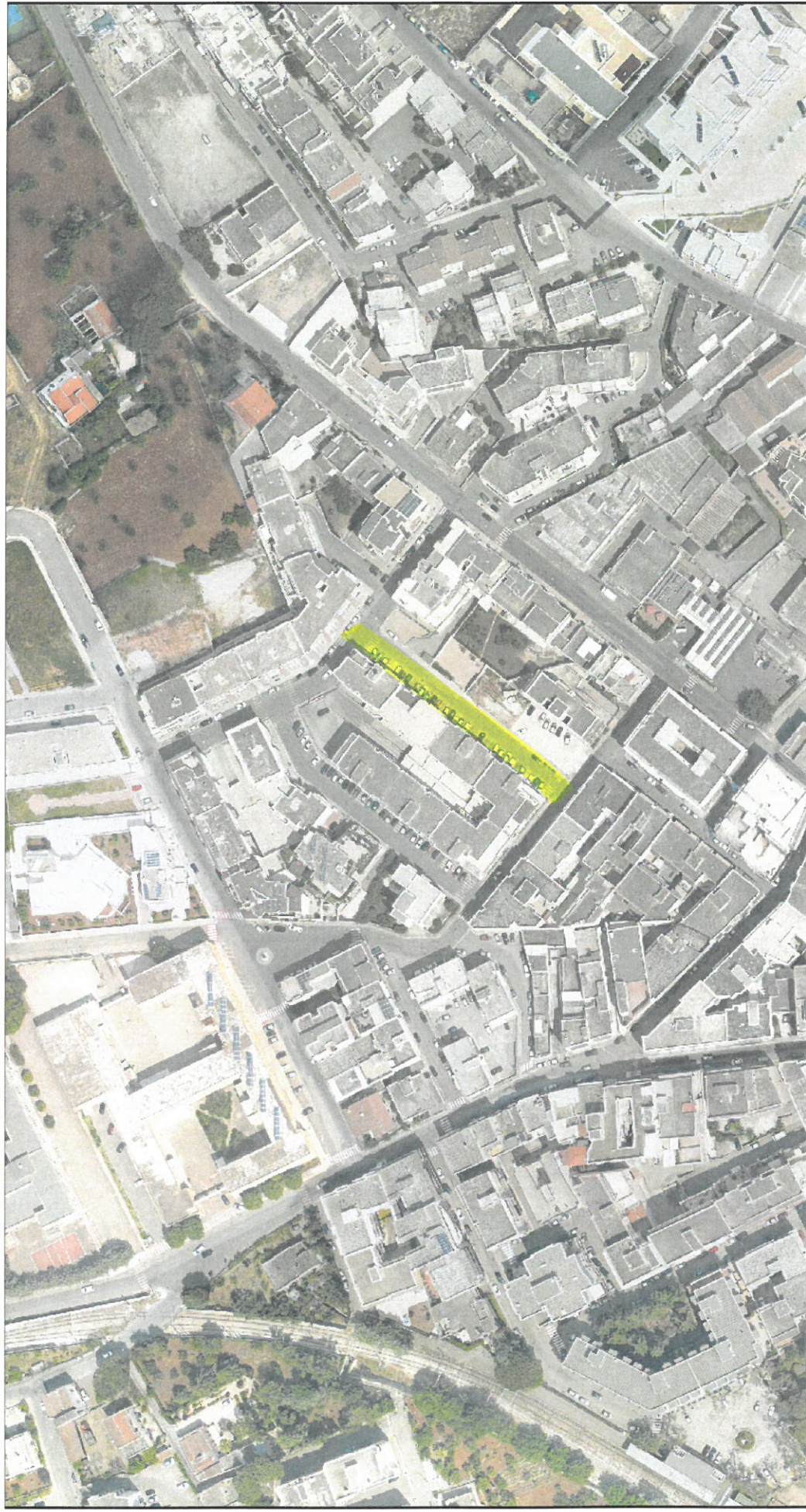
Tavola n. 2

Via Domenico Argese (1917 – 1996) economista