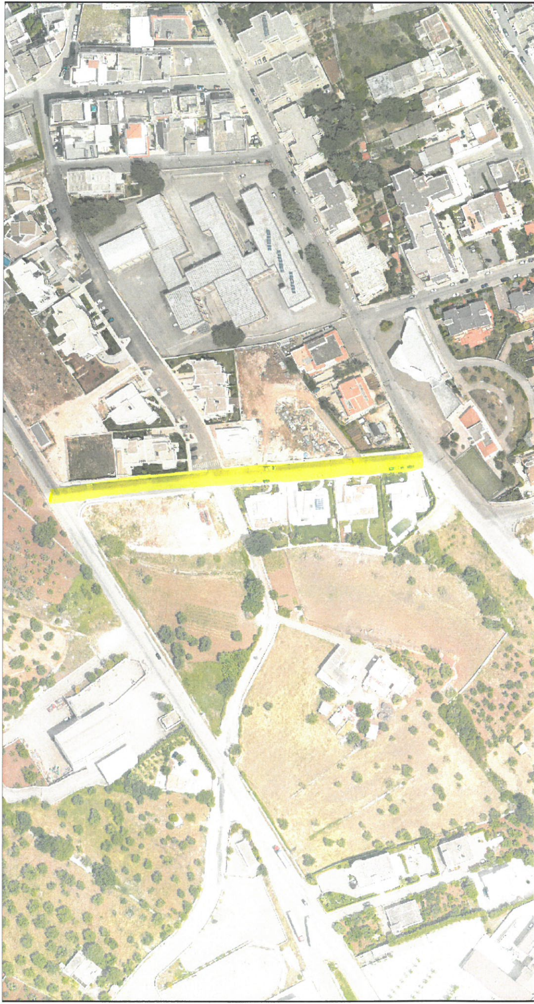
Tavola n. 3

Via Gaetano Montanaro (1925 – 2006) artista